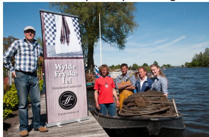
afbeelding 3, foto 4 juni 2013

In oktober 2013 hebben vier vissers in samenwerking met restaurants in Grou, Heeg, Dokkumer Nieuwe Zijlen in de week van de fryske smaak het fryske fisk menu gepromoot.