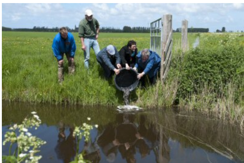
afbeelding: uitzet pootaal 23-5-2013

Friese binnenvisser 2.0 betreft daarnaast het verbeteren van het Friese (binnen) visserij bedrijf door een betere positionering in het cultuur historische landschap, onderbouwing van de maatschappelijk en ecologisch verantwoorde werkwijze en het uitbouwen van de economische activiteiten.