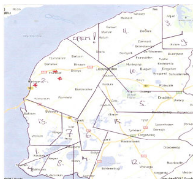
Figuur 1, verdeling viswater onder leden van de Fbvb, situatie eind 2012, J.Poepjes (8) is per 1-1-'13 gestopt.

De Friese bond verdeelt het viswater tussen de aangesloten leden (in 2009: 13.700 ha.). In 2012 zijn twee bedrijven gestopt; dit viswater is herverdeeld. Het totale viswater wordt vanaf 2013 bevist door 14 beroepsvissers (figuur 1). De bedrijfsgrootte varieert van kleiner dan 500 ha (4 bedrijven in 2010) tot groter dan 1.500 ha (2 bedrijven in 2010). De oogst (totaal aantal kg vis per hectare) van de verschillende wateren varieert van minder dan 3 kg tot meer dan 15 kg/ha. In totaal mogen de vissers van de Fbvb jaarlijks 36,6 ton paling en 18 ton snoekbaars vangen (vanaf 2011 tot 2015) en daarnaast zonder quotum wolhandkrab en zeelt.