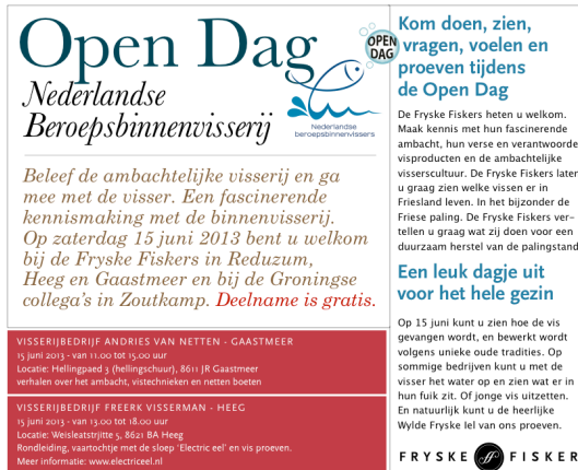
Afbeelding 2, poster open dag Is het merk "Wylde Fryske Iel" gelanceerd: